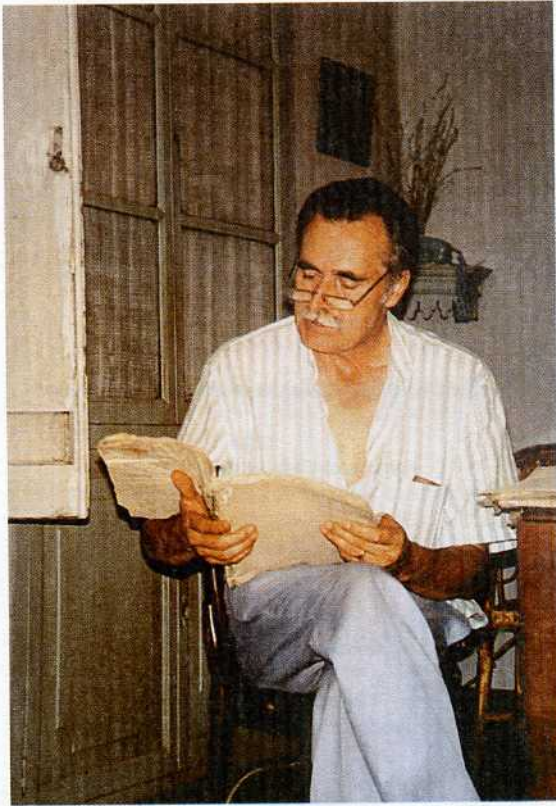
Mirant papers del vell arxiu Gil-Aznar a casa l'Hereu