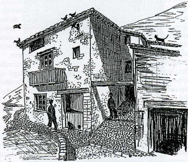
Lo Molinar segons un dibuix de Desideri Lombarte