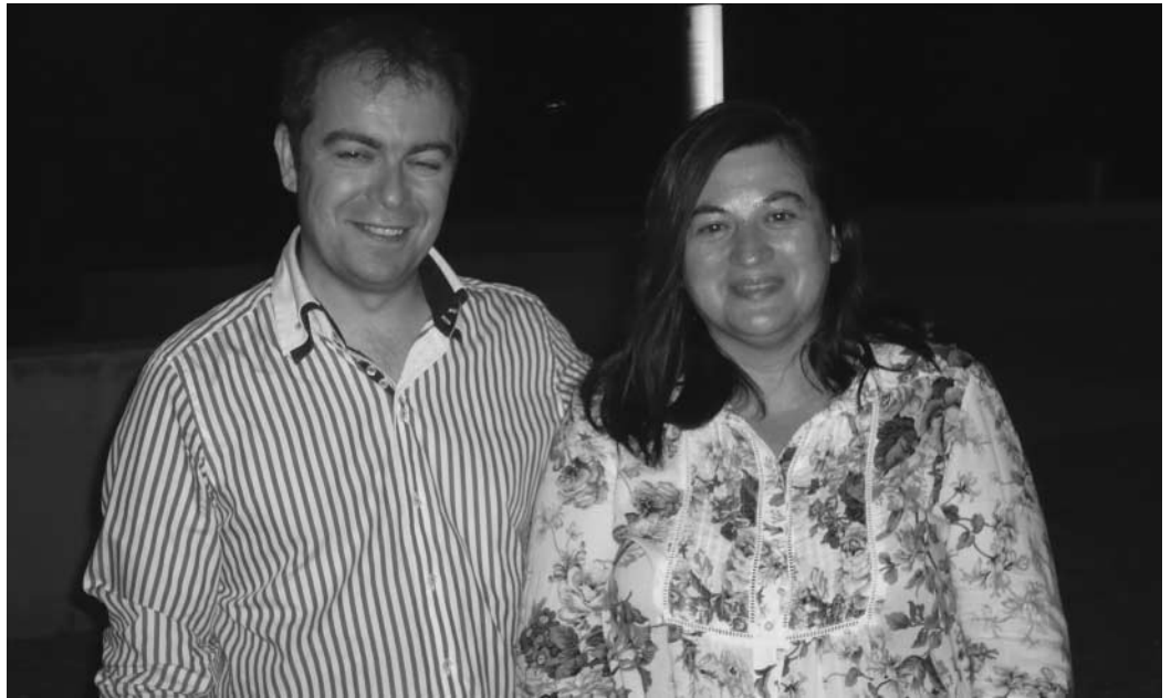
La cronista i l'escriptor Javier Sierra

A les 19:30 els escriptors van ser convocats al saló d'actes de l'església de Sant Miquel, on Javier Sierra, autor de obres tan destacades com La Dama Azul , La Cena Secreta i la Ruta Prohibida entre altres, amb el títol de "El novel·lista que intentava entendre els arcanes del món" va parlar d'aquestes