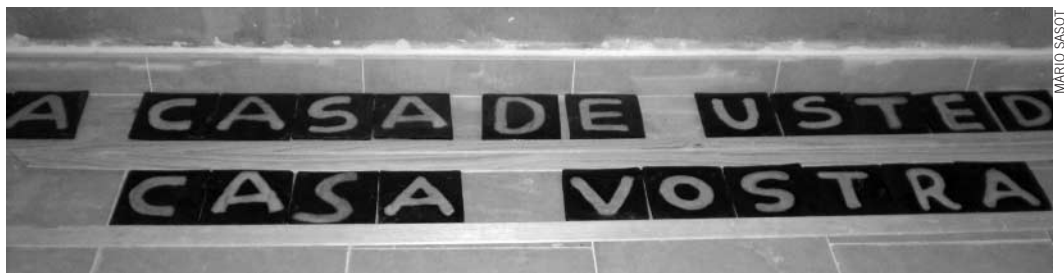
Rajoles amb el nom de la casa que es posaran a la façana