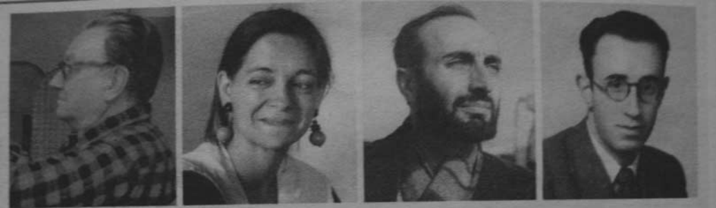
Joan Brossa, Maria Mercè Marçal, Josep Palau i Fabre, Màrius Torres