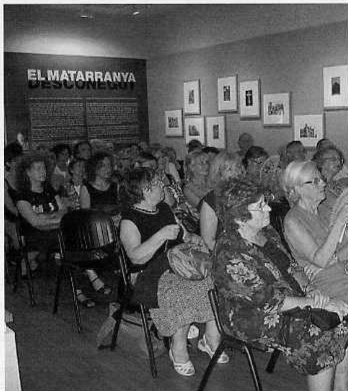
Públic assistent a l'acte de la Casa Amatller

Dimarts 14 de juliol va celebrar-se a la Casa Amatller de Barcelona, al bell mig del Passeig de Gràcia, una emotiva jornada de promoció de la literatura del Matarranya. L'acte, organitzat per l'Associació Cultural del Matarranya, va ser presidit per l'Oriol Izquierdo, director de la Institució de les Lletres Catalanes, amb la qual cosa li donava un significatiu suport institucional. Ens complau dir que la sala estava plena de gom a gom.