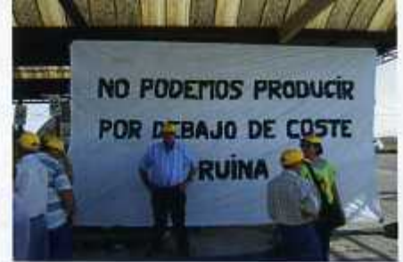
La guerra de la fruita Els llauradors del Baix Cinca ixen als carrers de Fraga contra els baixos preus i el monopoli dels majoristes.