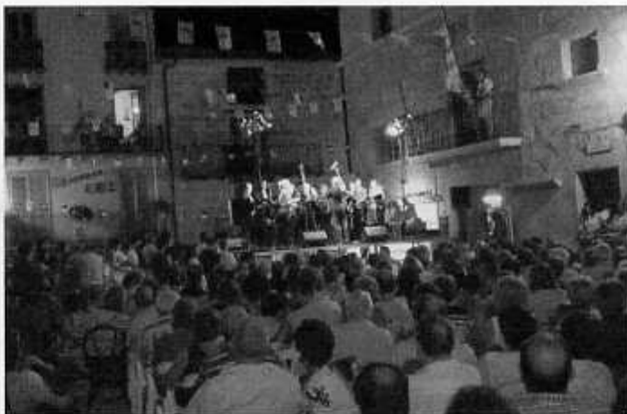
Actuació de la Coral de Beseit a la Plaça

L'homenatge a l'artista recentment desapareguda Gema Noguera a Beseit el 20 d'agost, en el prelude de les festes majors de la vila, va ser un gran encert i va demostrar l'agraïment dels artistes i del públic en general a una trajectòria personal de compromís amb la creació plàstica, la cultura i el territori. La jornada de la Trobada d'Artistes es va dividir en dues sessions. A la tarda, a la Galeria d'Art de l'Antiga Fàbrica Noguera es va inaugurar una exposició col·lectiva d'artistes que havien tingut alguna vinculació amb l'homenatjada i una mostra de l'obra de la creadora de la Gale-