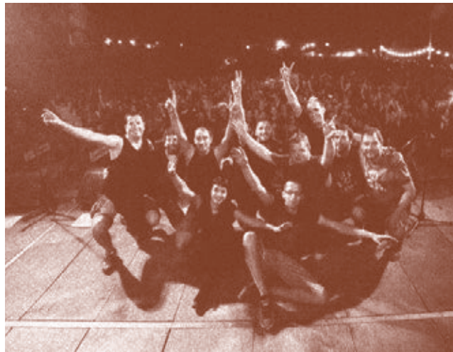
Los Draps a l'Aplec dels Ports de Villorejos, 2016