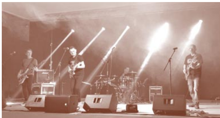
Eje Berlín en concert a Alcampell, octubre de 2022 (J. Espluga.)

A la Llitera, els ajuntaments més actius durant aquella època van ser els d'Albelda, Alcampell, Altorricó i Tamarit, que van generar un circuit musical radicalment modern (amb Binèfar com a centre gravitatori on tot podia passar, fins i tot aquella raresa del con-