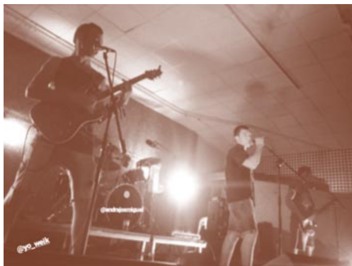
Grup Andrajos, de Saidí

A Fraga ha hi hagut grups, més aviat tecno i pop, i a Mequinensa va nàixer l'any