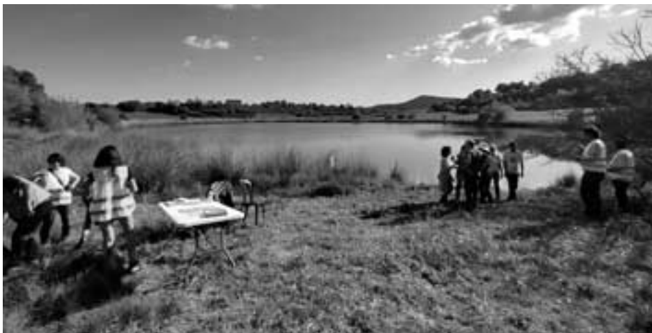
Geolodia a Estanya

El Geolodia 2022 es va dedicar a la visita i anàlisi dels estanys de la