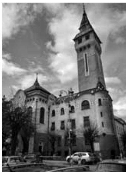
Palau de cultura de Târgu Mureș, capital del județ de Mureș C. M.