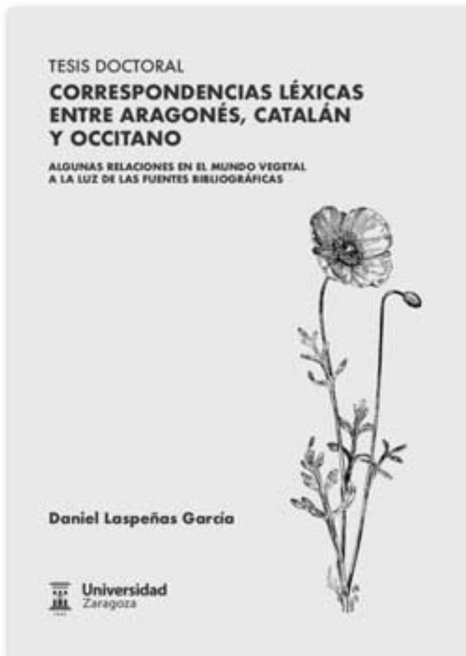
Coberta de la tesi doctoral de l'autor

En síntesi, podem afirmar que el treball és una descripció acurada i detallada de la distribució de la terminologia vegetal per la zona estudiada, la qual inclou en el seu sentit més ampli el sud de França i quasi tota la meitat oriental de la Península Ibèrica. Aquesta vasta geografia havia d'anar acompanyada d'un suport gràfic, cosa que s'ha aconseguit amb una sèrie de mapes que ajuden a visualitzar les correspondències més destacades. Cal advertir, però, que l'extensió dels resultats és desigual segons les espècies i llurs denominacions, perquè,