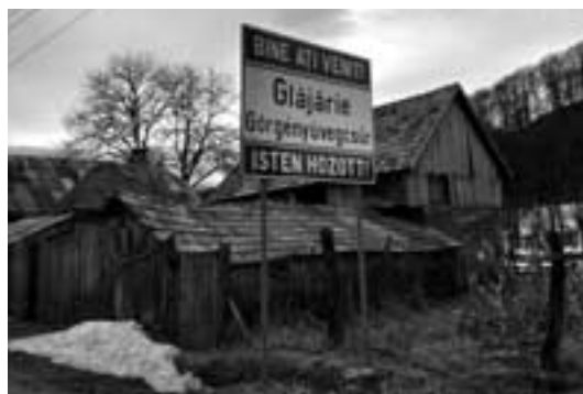
Retolació bilingüe de benvinguda a Glăjărie C. M.

Tot i l'atenció lingüística gairebé exemplar envers la minoria magiar en l'escola, no deixa d'haver-hi recels entre alguns docents de parla romanesa, que no acaben de veure amb bons ulls que col·legues de les escoles amb llengua vehicular hongaresa puguin fer classe en escoles romaneses i no a la inversa, com també s'interpreta com una intrusió la presència d'una universitat hon-