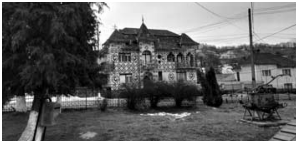
Arquitectura popular romanesa a Glăjărie C. M.

Transsilvània va pertànyer al Regne d'Hongria fins a 1918. Amb la integració de la regió a Romania i la instauració posterior del règim comunista (1947), la llengua hongaresa no va deixar de perdre prestigi social i parlants (per emigració) fins a la caiguda del comunisme (1989) i la proclamació de Romania com a república democràtica (1991), fet que