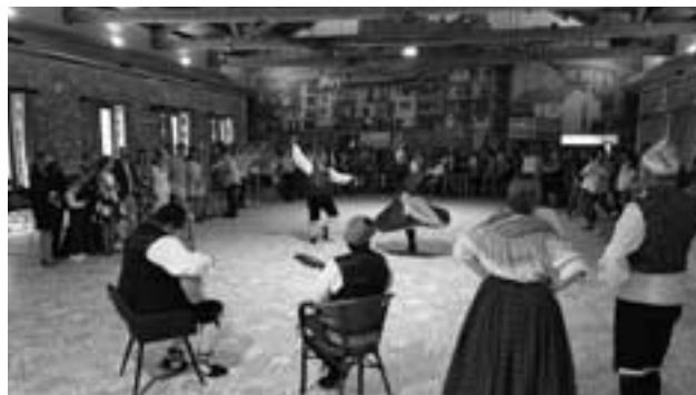
L'acte inaugural va incloure l'actuació d'un quadre de jota