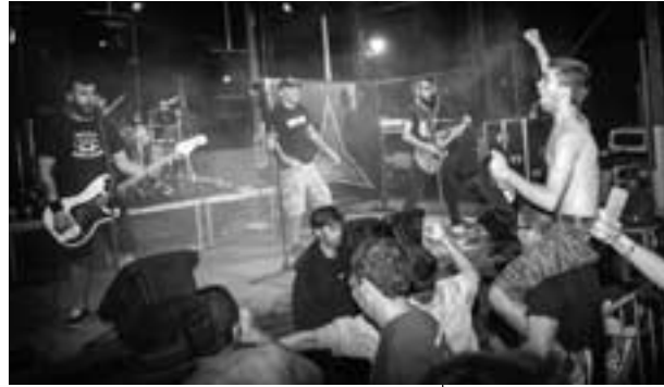
Kop al Franja Rock 2017 NEBULOSA GRÀFICA

Segona, lo text d'este 'manifest' diu que el MAT menteix quan diu que és la primera vegada que es fa un festival mediambientalment sos-