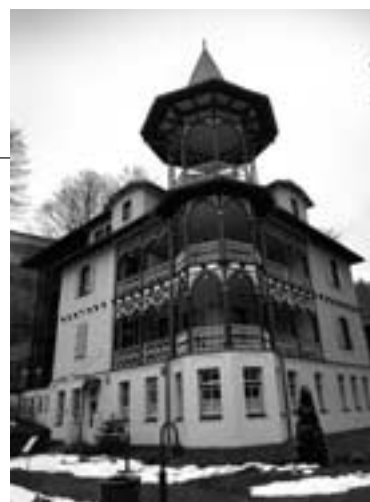
Arquitectura popular a l'estació balnearia de Sovata C. M.

va consagrar el romanès com llengua oficial, tot garantint alhora els drets fonamentals per a les minories ètniques i lingüístiques en àmbits com l'educació, les relacions amb l'administració i els mitjans de comunicació sempre que superen el 20% de la població local en cada cas. Tanmateix, el sistema educatiu romanès no ofereix l'oportunitat d'aprendre hongarès als estudiants de llengua materna romanesa.