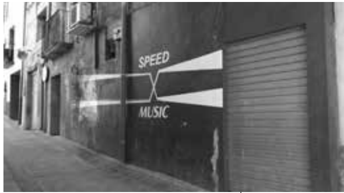
Façana de l'Speed Music P.E.

Els pubs eren bars amb música i sense finestres, cosa que els convertia en un territori alliberat. Els altres bars del poble tenien una clara segregació de gènere, eren