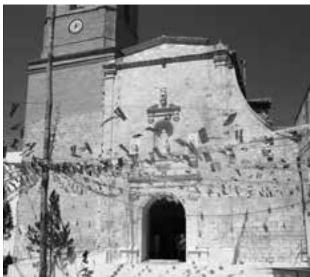
Església de Camporrells PEP ESPUGA

La Comarca de la Llitera va organitzar tres rutes d'autocar per a recollir persones de diferents localitats que hi volguessin assistir.